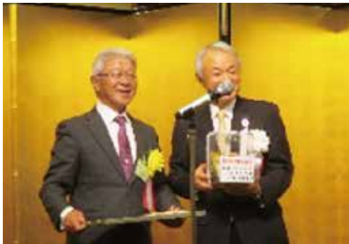
株式会社 クリーンカンパニー