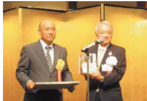
坪野谷商事株式会社