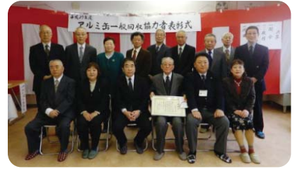
西近野町会 推薦拠点:(株)青森資源