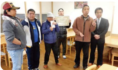
福浜会松ぼっくり 推薦拠点:(株)三光