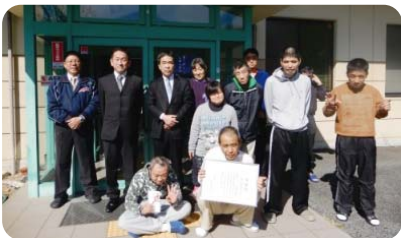
駿豆学園管理組合 推薦拠点:(株)藤原商店