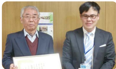
上石田町自治会 推薦拠点:(株)岩田商店