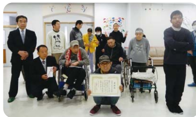
草笛の会 菊川寮 推薦拠点:(株)ニューリサイクル