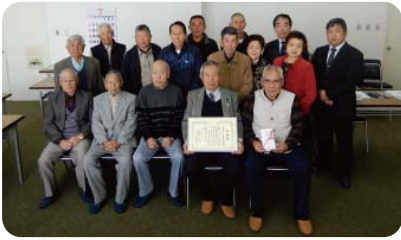
神埼市老人クラブ連合会千代田支部 推薦拠点:サンコーアルミ(株)