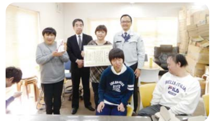
海田なかよし実習所 推薦拠点:(株)本田春荘商店