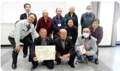
大須めばえ会 推薦拠点:(株)本田春荘商店