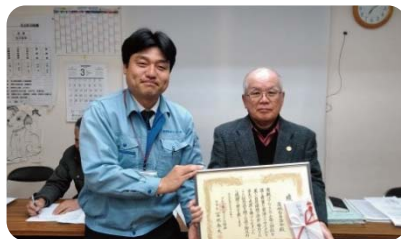
高城台自治会 推薦拠点:西部故紙センター(株)