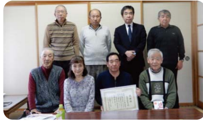
幸畑阿部野町会 推薦拠点:(株)伸和産業