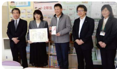
河内小学校PTA子供会 推薦拠点:(株)きやま商会