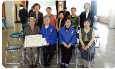
第二小瀬戸むつみ会 推薦拠点:小江原産業