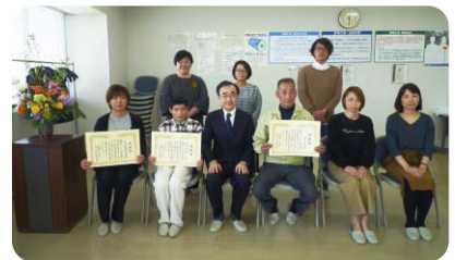
滋賀での合同表彰式(エルごとの家・西川組・大宝西幼稚園保護者会) 推薦拠点:(株)昭和アルミ缶リサイクリングセンター