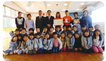
松葉保育園まつぼっくりの会 推薦拠点:(株)トリックスメタル