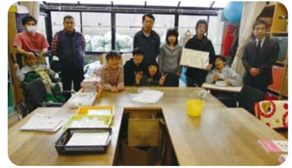
KOMNYすみれの家 推薦拠点:(株)藤原商店