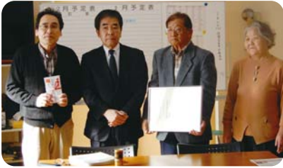
沖館第三町会 推薦拠点:(株)伸和産業