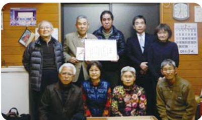
横尾だんじり保存会 推薦拠点:(株)イワフチ