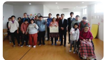
糸島たんぽぽ 推薦拠点:(株)糸島産業