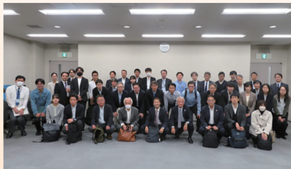
港資源化センター内にて

東京都廃棄物埋立処分場様は、不燃ごみを一日当たり240トン受け入れ、破碎し鉄・アルミニウムを回収した後の残渣や焼却灰などを埋め立てています。今のペースで埋め立てていくと埋め立て処分場の寿命は50年であることを学び、資源化できるものを分別してごみの発生量を減らす努力を継続していかなければならないことを実感しました。