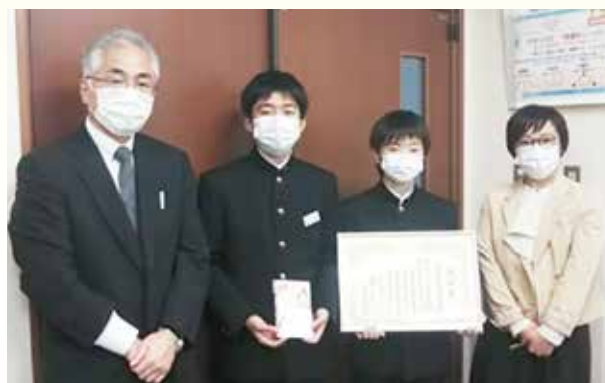
藤岡市立小野中学校