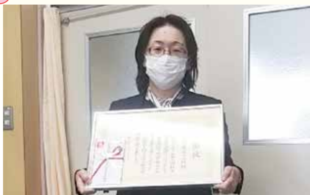
高崎市立馬庭小学校