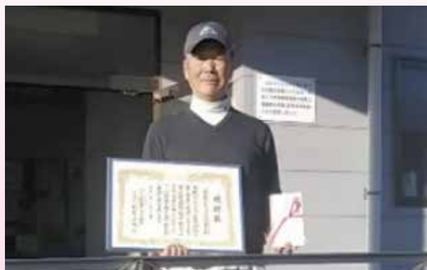
榛東村20区リサイクル活動部